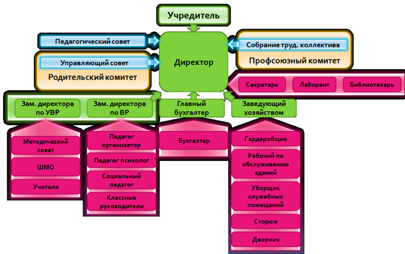
Схема «Организационная структура МОУ «Средней школы №7»

и взаимодействие с другими субъектами образовательной политики: